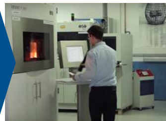
Produktion in der nach FDIS ISO 9001:2015 zertifizierten LMD Spezialfertigung