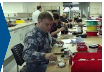
Qualitätskontrolle, optionale Nachbearbeitung & Montage in der LMD Manufaktur