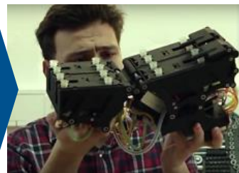
Mechatronische Kombination: gesinterte, elektronische & Zubehör-Komponenten